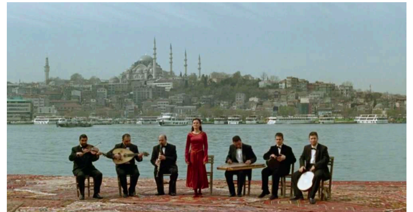
Head on de Fatih Akin