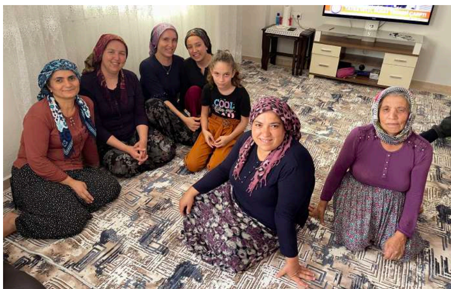
Été 2021 : Première rencontre avec ma famille, dans le village de mon père

Après plusieurs tentatives de choix infructueux (j'ai moi-même testé trois filières universitaires avant de faire du théâtre), elle se décide à aller voir une conseillère d'orientation. Cette femme, personnage pittoresque à la personnalité déjantée, l'incite fortement à se pencher sur ses origines turques dont elle ne connaît presque rien.