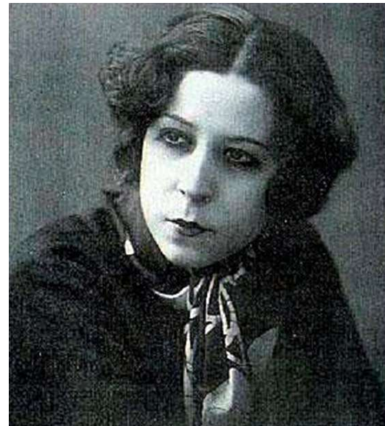
Afife Jale, première actrice musulmane en Turquie (1902-1941)

Pour la forme du spectacle, j'ai fait le choix d'une grande simplicité scénographique. Mon objectif est de tisser une théâtralité dans l'alternance entre des dialogues très vifs et incarnés, empreints d'une certaine drôlerie, et des séquences physiques burlesques ou dansées, rencontres incongrues de Jacques Tati avec le hip hop. Au final, il s'agit de raconter avec la liberté d'un corps joyeux le long chemin vers l'affirmation d'un désir de vie.