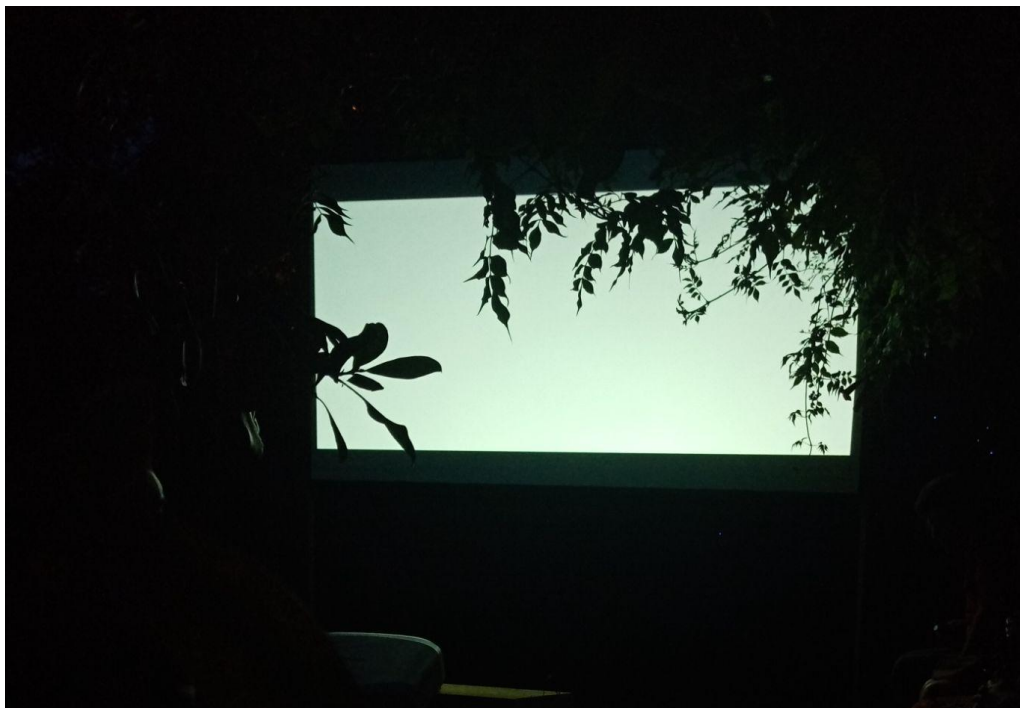
Jardin de Vitry - Juin 22

Nous souhaitons également traduire cette performance pour qu'elle puisse se jouer dans d'autres langues et sous d'autres formes d'écriture, notamment reposant sur des idéogrammes.