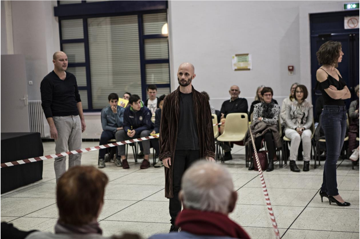
- Les Brèves du futur à la Comédie de Valence