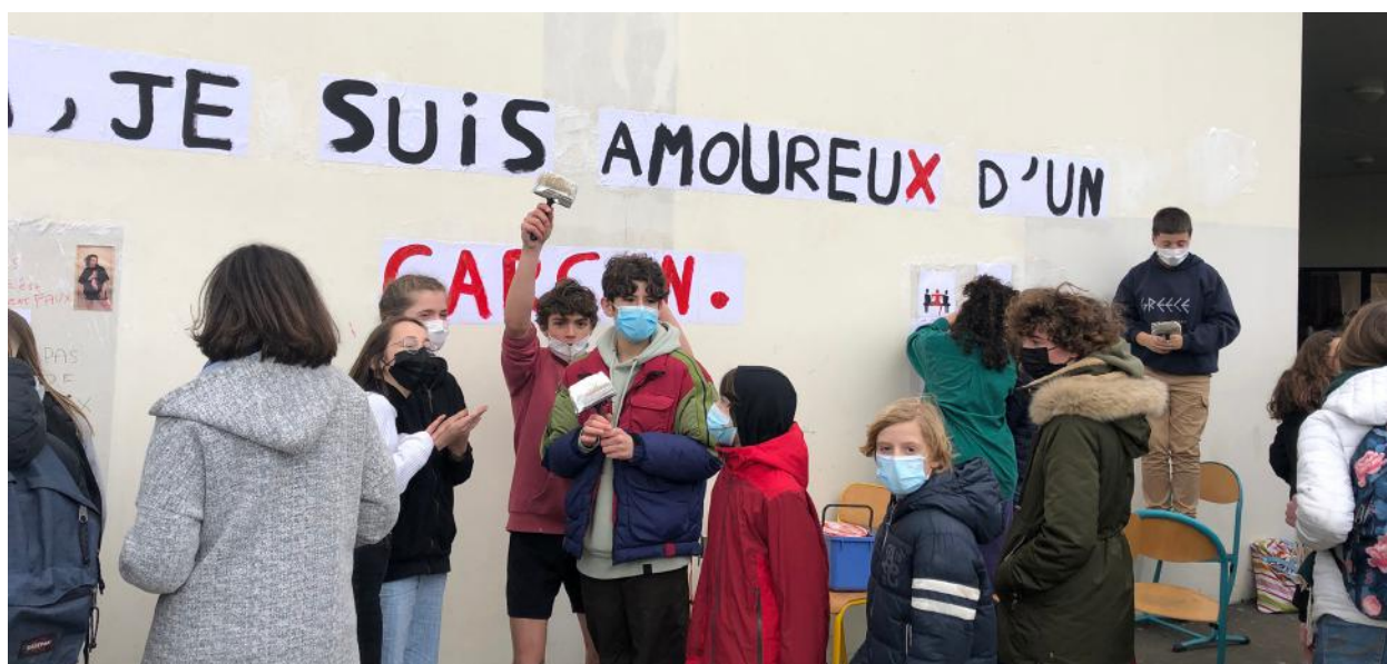
Séance de collage avec les collégien.nes du collège Letot, à Bayeux

La Compagnie les Grandes Marées propose une série d'actions culturelles autour des représentations (dossier sur demande). Une rencontre suit chaque date en salle de classe.